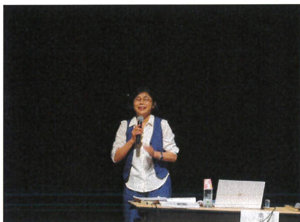
講演「障害のある人の暮らしを支える支援ツール みとおし・えらぶ・おはなし」