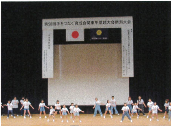
オープニングセレモニー